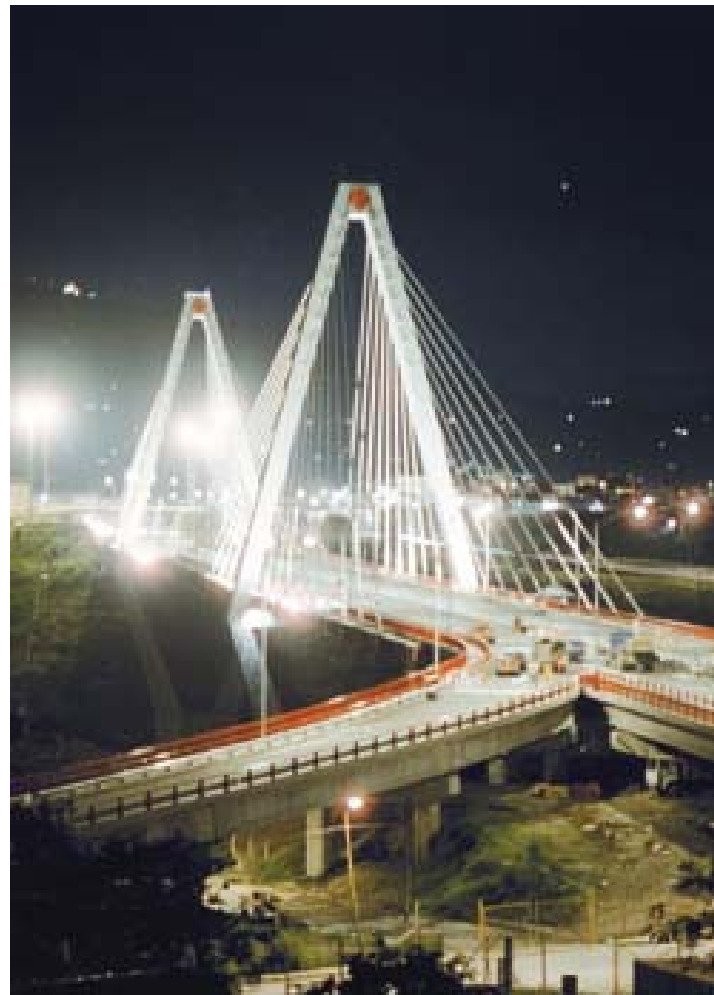
Pereira "Ciudad de Progreso"